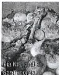
Boa Vida: O guia de gastronomia

Rota das Tapas: 104 razões para correr Lisboa, Porto e Braga